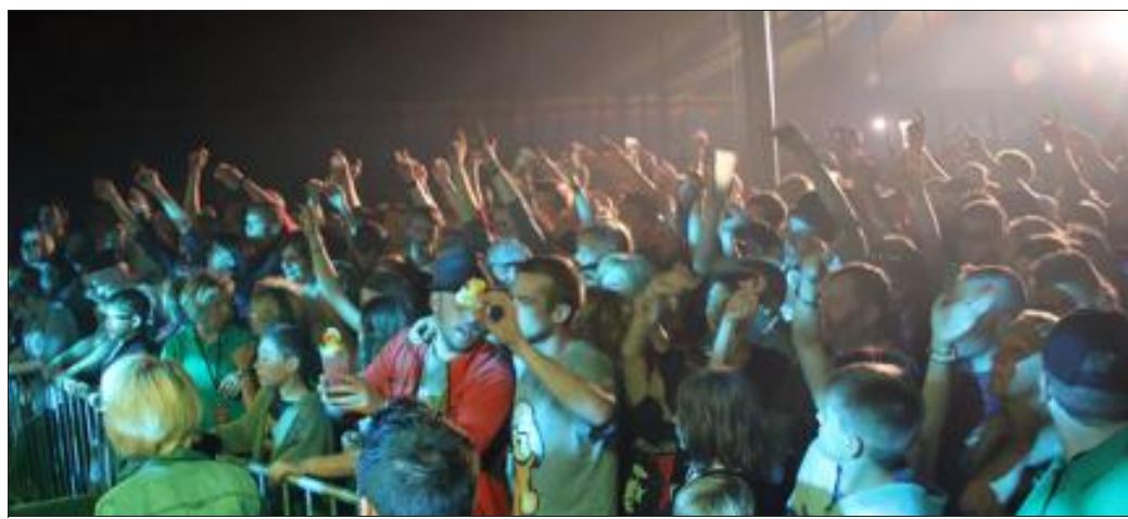
Des vrais fans, et un public chauffé à blanc, toute la soirée, sous le chapiteau dressé près du stade de Saint-Louis-lès-Bitche.