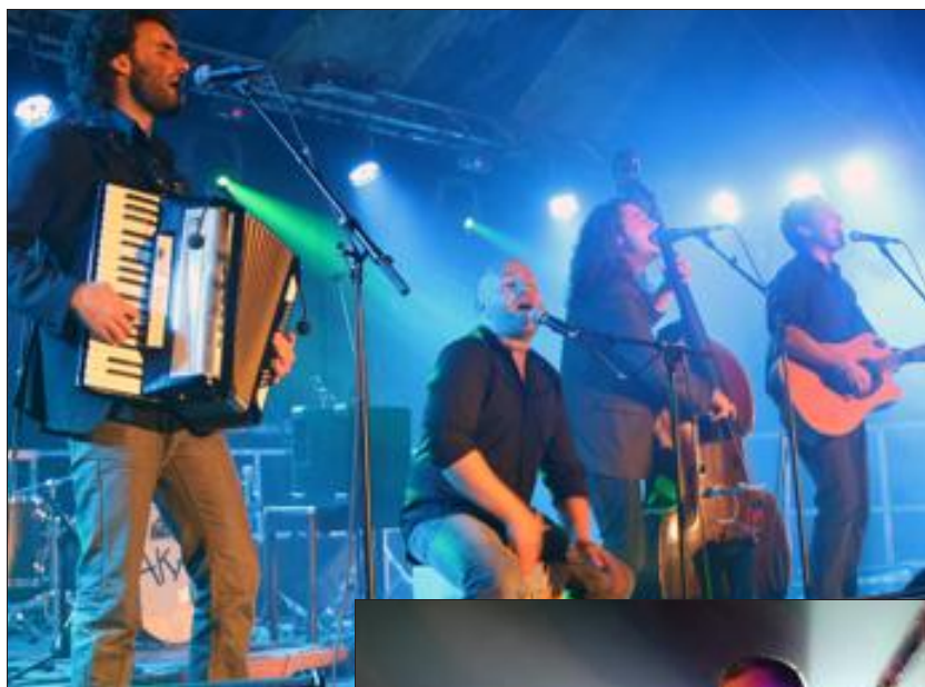
Les Garçons trottoirs sont connus dans le Pays de Bitche. Ils n'ont pas failli à leur réputation.