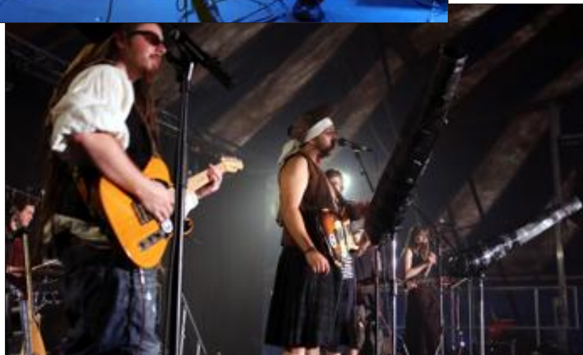
Akab a invité les festivaliers à suivre le voyage du capitaine Archibald King.