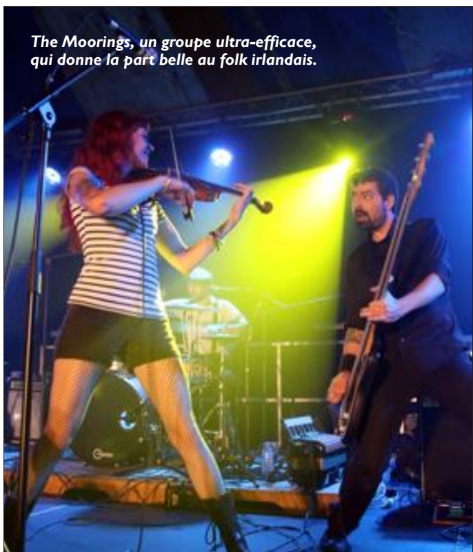
The Moorings, un groupe ultra-efficace, qui donne la part belle au folk irlandais.

Le second festival de la Mailloche s'est terminé samedi, tard, très tard dans la nuit. Et quelle édition ! Cinq groupes ont été rassemblés sous le chapiteau. Les bénévoles qui ont organisé ce concert sont aux anges.