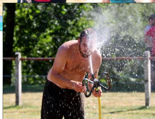
Pause fraîcheur indispensable pour tenir tout l'après-midi...