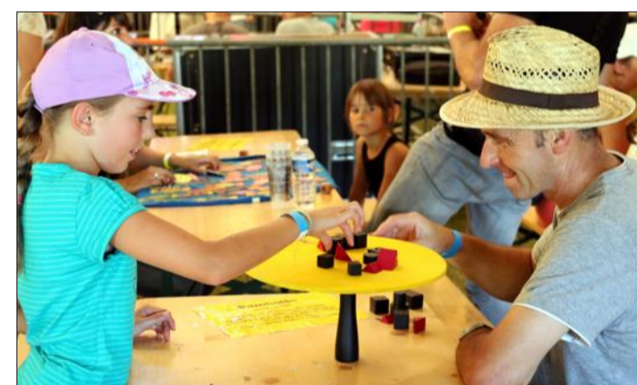
Parents et enfants se sont longuement affrontés aux grands jeux en bois, installés sous le chapiteau.