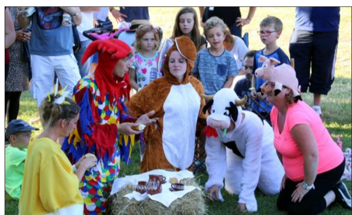
Au vu de l'affluence, la comptine destinée au jeune public a été jouée à deux reprises, à l'ombre de la fontaine du Hofferbrunne.