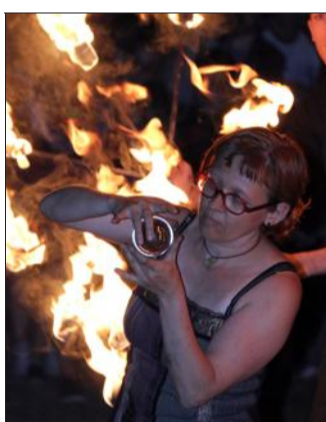
Des jongleurs de feu ont accompagné les spectateurs.