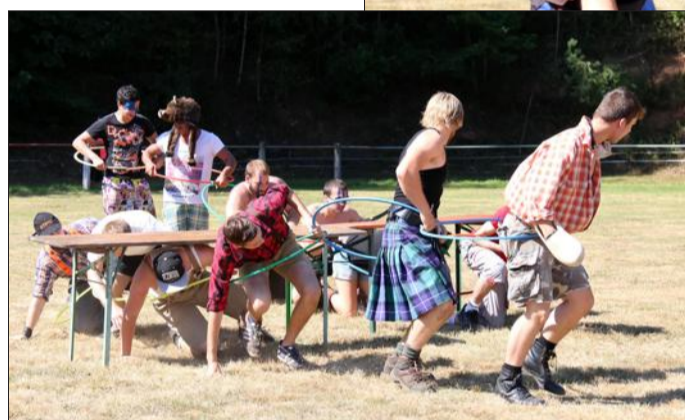
Certains ont affiché de drôles d'accoutrements. Mais ils assument !