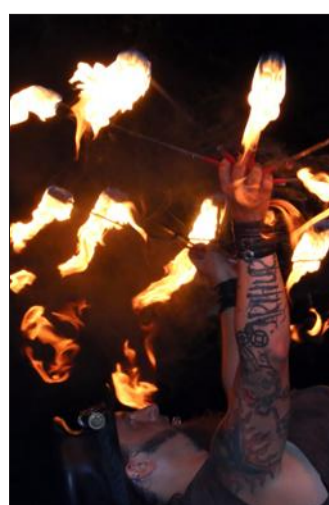
Deux heures de spectacle et un final enflammé...

théâtre spécialement écrite pour eux. Dynamique et rigolote, La petite poule leur a expliqué comment réaliser sa baguette de pain soi-même, sans compter sur l'aide des autres animaux qui n'en faisaient qu'à leur tête. Avant de partager avec eux le fruit de son travail. Une comptine, jouée à deux reprises, qui leur a expliqué l'entraide et l'importance du travail fait main. Sous le chapiteau, les nombreux jeux anciens n'ont pas désempé. Parents et enfants se sont souvent affrontés, dans de grands éclats de rire. En extérieur, les petits ont aussi pu s'affronter à la course en sacs, ou faire de petites balades en poneys.