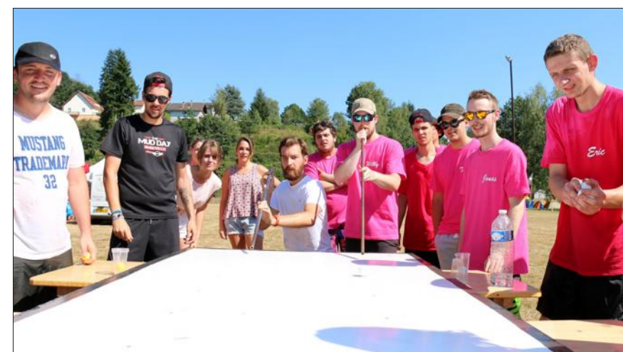
Le but, souffler dans des cannes de verrier pour diriger des balles dans des trous.