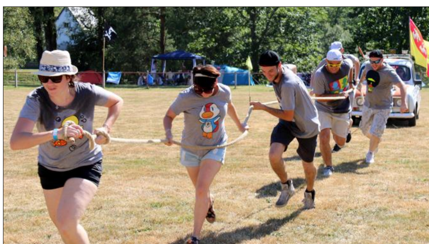
Ah ! le tirer de 4 L, une épreuve mythique de ces jeux !