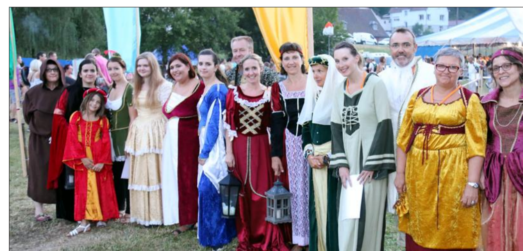
Les nombreux guides, en costumes, ont accompagné les groupes dans leur balade contée qui a ravi près d'un millier de curieux vendredi soir.

Les groupes ont été pris en charge par des guides costumés et ont suivi un cheminement